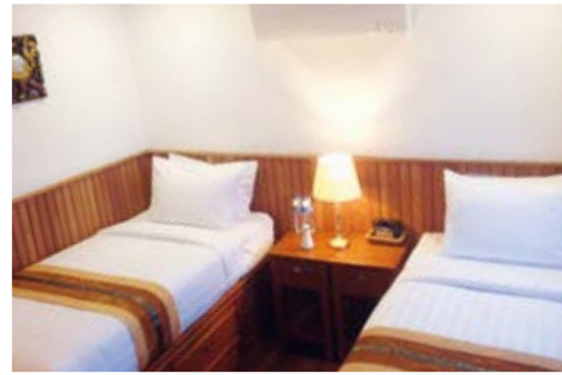
Cabine Doeluxe Baie vitrée, pont Principal